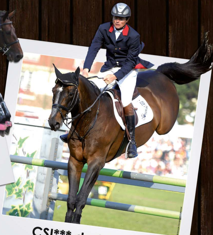
CSI*** de SAINT-LÔ 15 - 17 octobre 2010