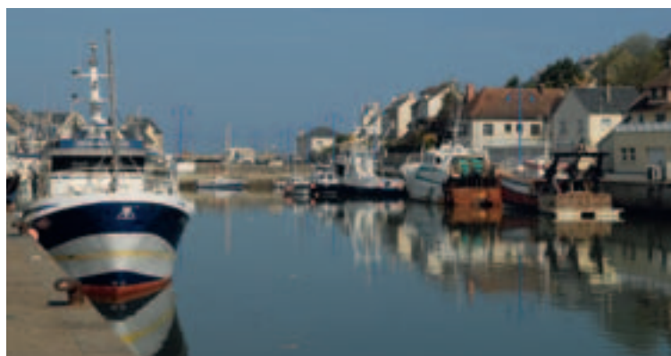
Port-en-Bessin - Basse-Normandie