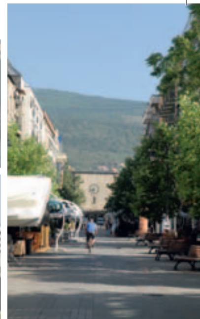
Vieille gare de Skopje