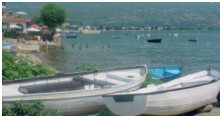
Ohrid - Macédoine