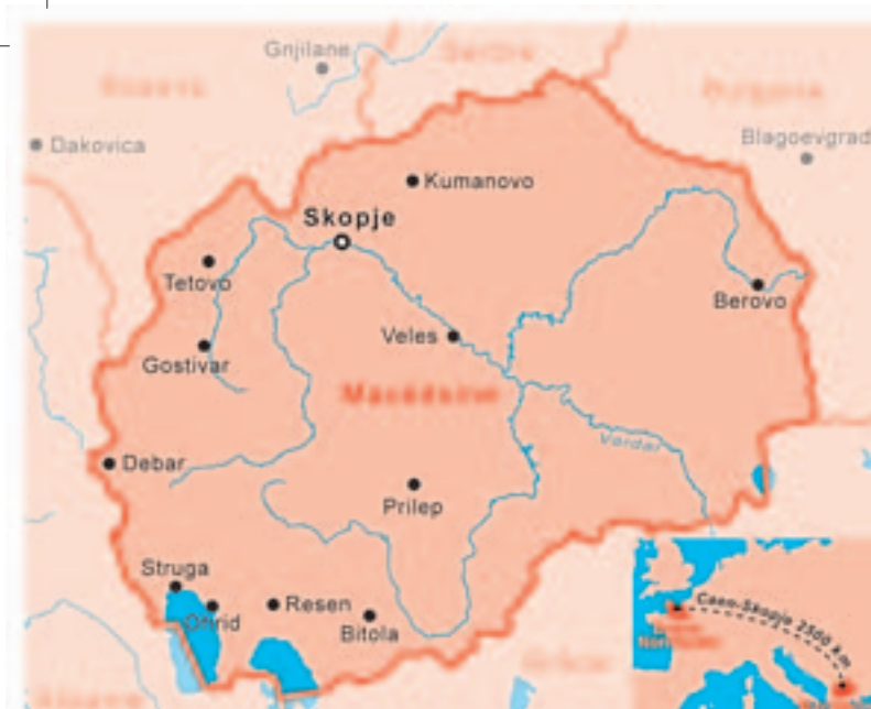
Ville de Stip