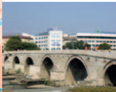
Pont de Pierre Skopje